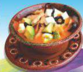
LA SOPA DE TORTILLA