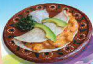
EL TACO CAMARÓN