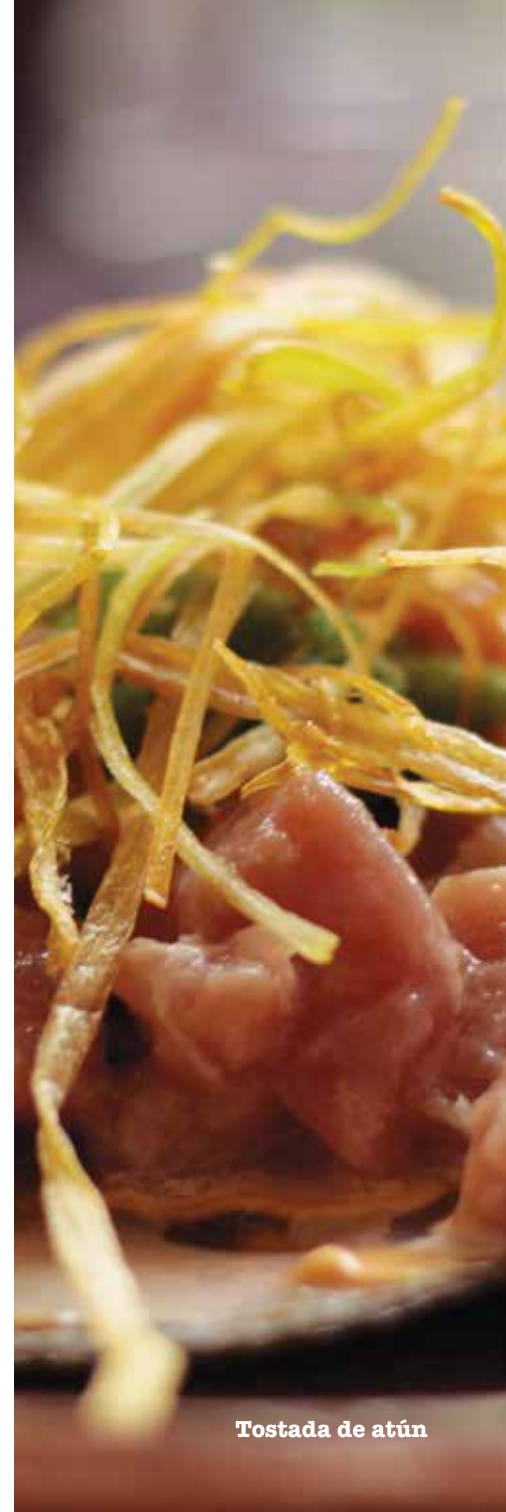
Tostada de atún