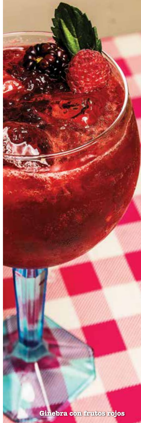
Ginebra con frutos rojos