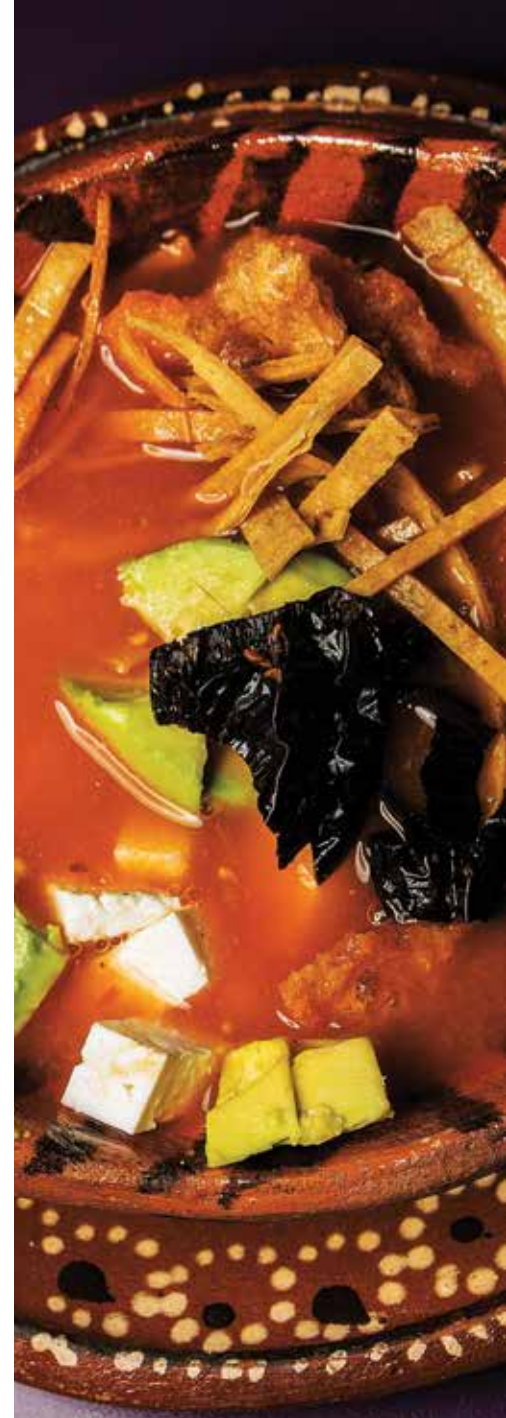
Sopa de tortilla